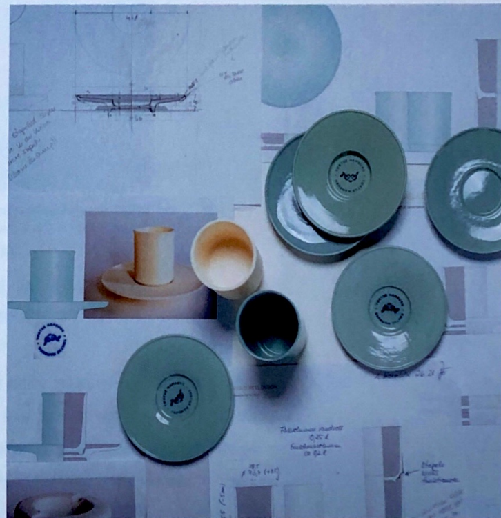
Photos und Zeichnungen: Mikaela Dörfel.